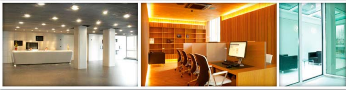
Weltausstellung in Zaragoza